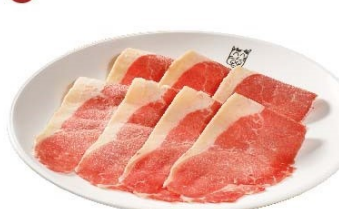
美洲西冷牛肉 American Beef Sirloin