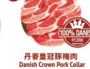
丹麥皇冠豚梅肉 Danish Crown Pork Collar