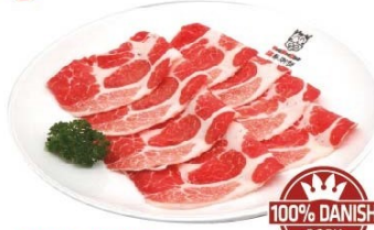
丹麥皇冠豚梅肉 Danish Crown Pork Collar