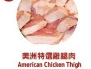
美洲特選雞腿肉 American Chicken Thigh