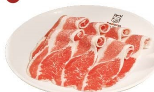
加拿大特級牛胸腹 Canadian Supreme Beef Short Plate