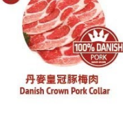
丹麥皇冠豚梅肉 Danish Crown Pork Collar