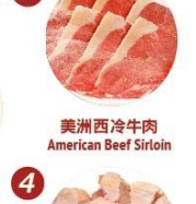
美洲西冷牛肉 American Beef Sirloin