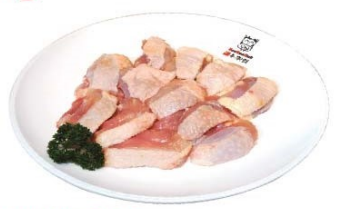
美洲特選雞腿肉 American Chicken Thigh